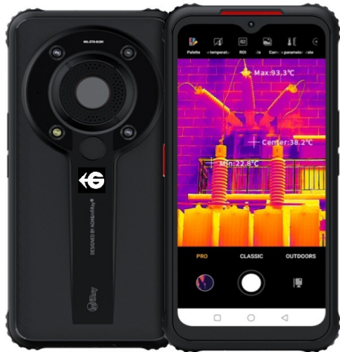
SmartPhone 5G PX1 Termografica 256 X 192